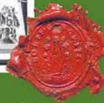
Altes Gemeindesiegel von Gorknitz.