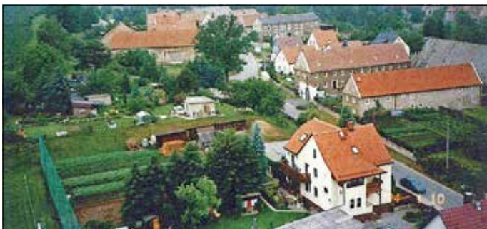
Gorknitz, ein Ort mit viel Herzblut für den Sport, wird 700 Jahre

LSV Gorknitz 61 e. V., Feuerwehrverein Gorknitz e. V., Heimatverein Ortschaft Röhrsdorf e. V.