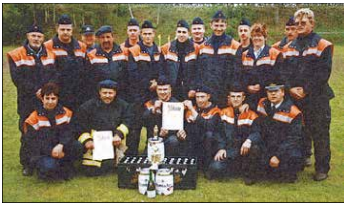
Die FFW Gorknitz nach erfolgreichem Wettkampf vor etlichen Jahren - 82 Jahre im Ort.

Sport bringt Leben ins Dorf und führt Menschen unserer Dörfer, in der Gemeinde der Stadt Dohna und darüber hinaus zusammen. Ein sozialer Aspekt, welcher nicht verkannt werden sollte.