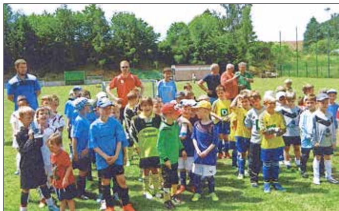
Nachwuchs-Turnier an den Fußball-Tagen. Seit 2020 nicht mehr möglich (vorerst).

Nach Ostern wird man sehen, wie sich die wieder steigenden Infektionszahlen auf das öffentliche Leben, die Wirtschaft sowie auf den erhofften Sportbetrieb auswirken, Fragen über Fragen!