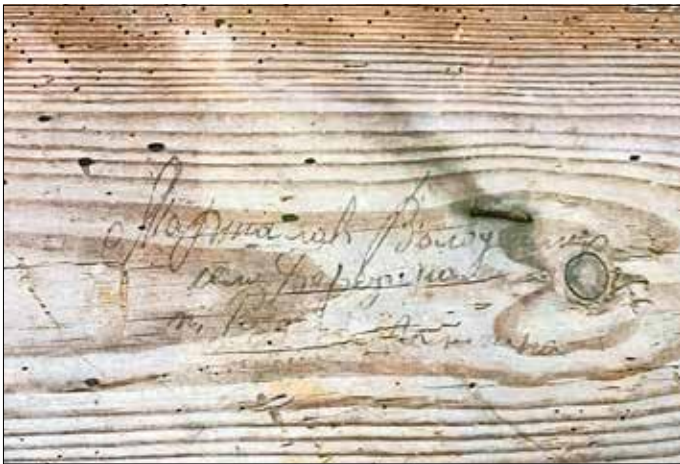
Holzbrett aus Schmörsdorf, auf dem ein „Ostarbeiter“ seinen Namen hinterlassen hat.

Der christliche Glauben schenkt Vergebung, aber das heißt nicht, dass wir vergessen dürfen. Zu erinnern bleibt in der deutschen Geschichte an die Schreckensherrschaft des Nationalsozialismus mit Millionen von Opfern. Dazu gehörten auch etwa 13,5 Millionen Zwangsarbeiter, die während des Krieges zum Einsatz kamen.