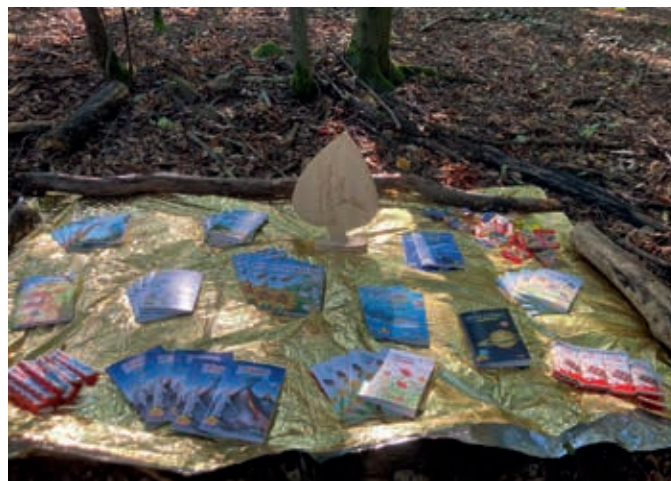
Die Preise – eine kleine Motivation