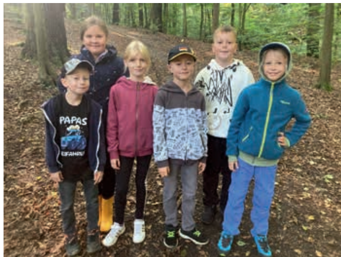
Team Grundschule Mühlbach

Ende September ging es für sechs Kinder unserer Grundschule zum Naturkundewettbewerb in die Spargründe Dohna. Klasse 2 bis 4 entsandten jeweils einen Jungen und ein Mädchen, welche die Grundschule Mühlbach vertreten sollten. Eingeladen hatte die Marie-Curie-Grundschule Dohna Schulen der näheren Umgebung, welche sich mit Wissen aus Natur und Umwelt messen sollten. In Aussicht standen der Wanderpokal und weitere kleine Preise. Mit Klemmbrettern und Stiften stürzten sich vier Rätselgruppen auf die zahlreichen Stationen. Das Wissen aller Teammitglieder war gefragt, denn die Themenbereiche waren vielfältig. Vom Aufbau der Erde und Vulkanen über Frühblüher, Arten von Vogelnestern bis hin zur Unterscheidung von Bäumen anhand ihrer Rinde, waren sehr viele Wissensbereiche gefragt. Schnell wurde den Kindern bewusst, dass das reine Schulwissen nicht ausreichen wird. Dennoch tüftelten die Kinder eine Stunde lang hoch konzentriert. Vor allem war es ganz still im Wald, denn man wollte natürlich nicht riskieren, dass eine andere Gruppe die Lösung hören kann. Am Ende wurde der Sieger ermittelt. Den Wanderpokal konnten wir dieses Jahr nicht gewinnen, aber nächstes Jahr gibt es sicher wieder eine Chance. Wir danken der Grundschule Dohna für die Ausrichtung des Wettbewerbes und freuen uns schon auf den nächsten Rätsel- und Knobelspaß.