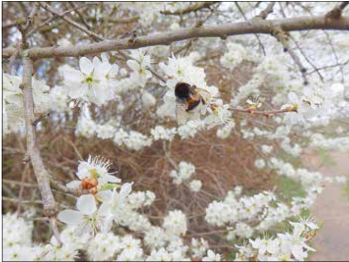
Hecken leisten einen wichtigen Beitrag zum Klimaschutz. Sie verhindern Bodenerosion, speichern Kohlendioxid und schaffen zugleich wertvolle Lebensräume für zahlreiche Tierarten. Besonders für Insekten stellen sie eine wichtige Nahrungsquelle dar.

klimaangepassten, biodiversitätsfördernden und ökologisch wertvollen Gestaltungs- und Erhaltungsmaßnahmen in Offenland-, Wald- und Gewässerbiotopen sowie in Siedlungsräumen und landwirtschaftlich genutzten Flächen. Öffentliche Veranstaltungen zur Information und Beteiligung der Bevölkerung sind geplant und werden rechtzeitig angekündigt. Kontakt: Susanne Ziemer, Landschaftspflegeverband Sächsische Schweiz-Osterzgebirge e.V., Tel: 03504-629669, E-Mail: ziemer@lpv-osterzgebirge.de .