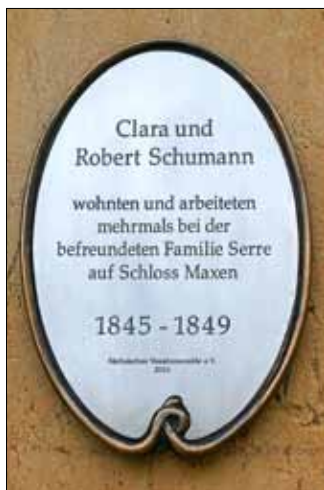
Medaillon am Schloss Maxen - 2013

Anlässlich des 200. Geburtstages von Clara Schumann erlebte Schmorsdorf im Rietzschele-Hof am 28. September eine bewegende Veranstaltung des Heimatvereins Maxen e. V. mit einer Lesung aus heimlichen Liebesbriefen von Clara und Robert bis 1840 und Kompositionen des Paares von der „Träumerei“ bis „Mein Stern“. Das Konzert reihte sich ein in eine Vielzahl von Aktivitäten, die dort seit der Eröffnung des Lindenmuseums „Clara Schumann“ stattfanden. Über das Schumann-Netzwerk in Bonn, das über die zahlreichen Wirkungsstätten von Clara und Robert Schumann, Veranstaltungen und Publikationen