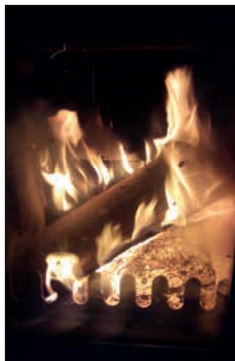
Lindenfeuer Dezember 2019 Das Foto von fröhlich blickenden Schmorsdorfer und Crottaer können Sie im nächsten Gemeindeblatt nach deren Einverständniserklärung ansehen. Bleiben Sie neugierig.