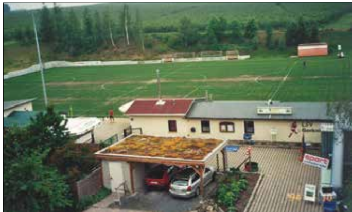
Unsere schöne Sportanlage