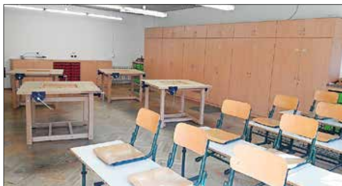
Der neue Werkraum der GS Mühlbach