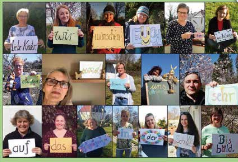
Foto April 2020; Osterwünsche von den Lehrern an die Schüler*innen der Grundschule