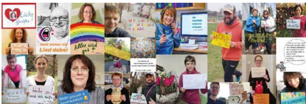
Foto April 2020; Wünsche von den Lehrern an die Schüler*innen der Oberschule

Die Schulgemeinschaft der Grund- und Oberschule