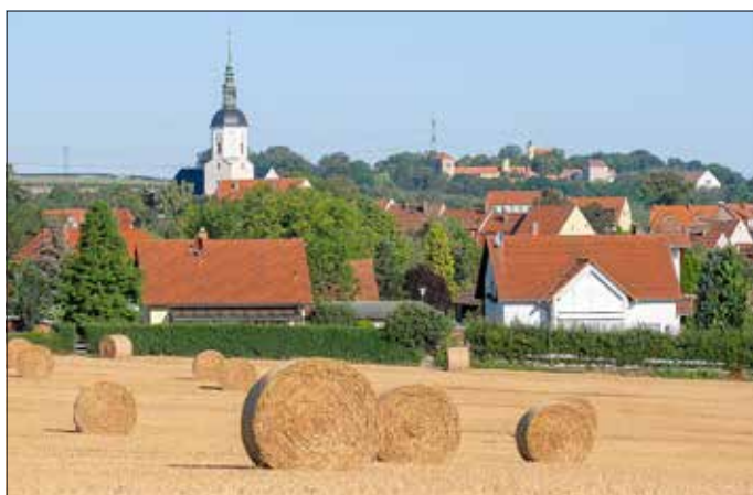
Sommer in Dohna – mit wunderschönem Blick auf die Stadtkirche und Gut Gamig e.V. im Hintergrund