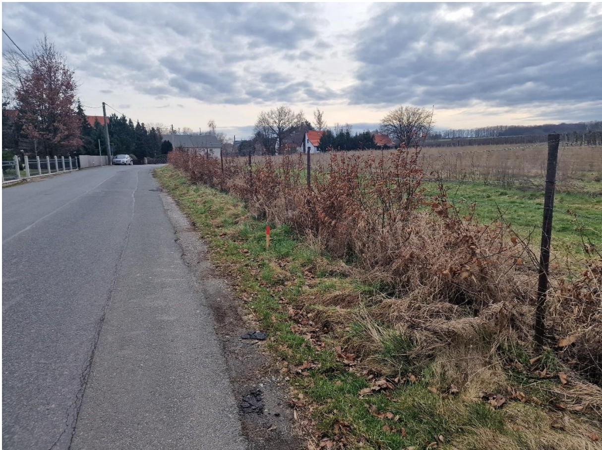
Abb. 3: Blick von Norden auf das Plangebiet,

Der Geltungsbereich des Bebauungsplanes liegt am nördlichen Rand der Ortslage Sürßen. Das Plangebiet grenzt im Norden und Westen an eine Obstplantage an. Im Osten grenzt das Plangebiet an die Kreisstraße und straßenbegleitende einreihige Mischbebauung auf der gegenüberliegenden Straßenseite an. Am nördlichen Ende des Plangebietes befindet sich auf der gegenüberliegenden Straßenseite eine Kindertageseinrichtung (KiTA).