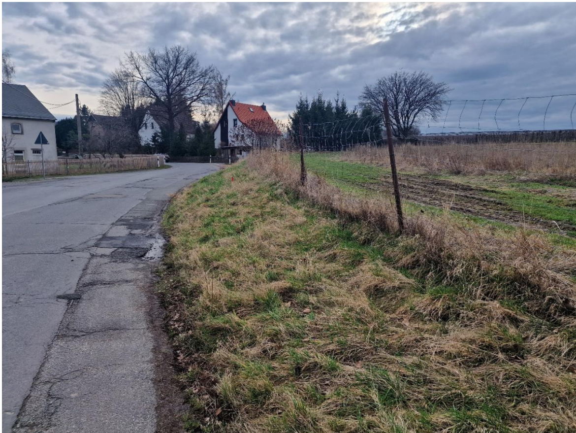
Abb. 2: südliche Grenze des Plangebietes mit Böschung von der Straße.

Das Plangebiet neigt sich von Ostrordosten nach Westsüdwesten um ca. 2 m. Im Bereich der Kreisstraße K8768 treten Höhen von 225 m NHN auf. Entlang der Straße erstreckte sich parallel zur Grenze des Plangebietes eine Böschung mit einem Höhenunterschied von 1,5 m an der südlichen Ecke, zur Mitte des Baufeldes ausläuft.